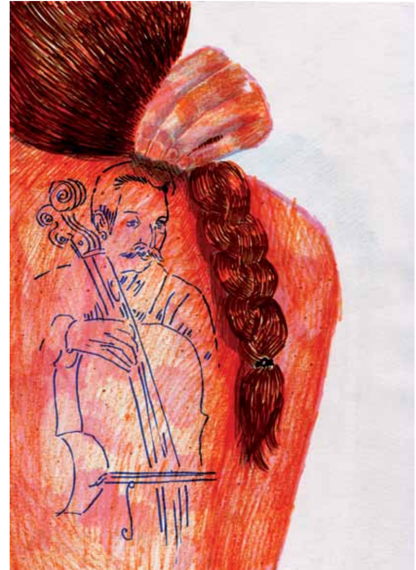
גליה פסטרנק, Gauguin Tattoo , 2013, עפרונות על נייר, 29x21, אוסף האמנית Galia Pasternak, Gauguin Tattoo , 2013, pencils on paper, 29x21, artist's collection