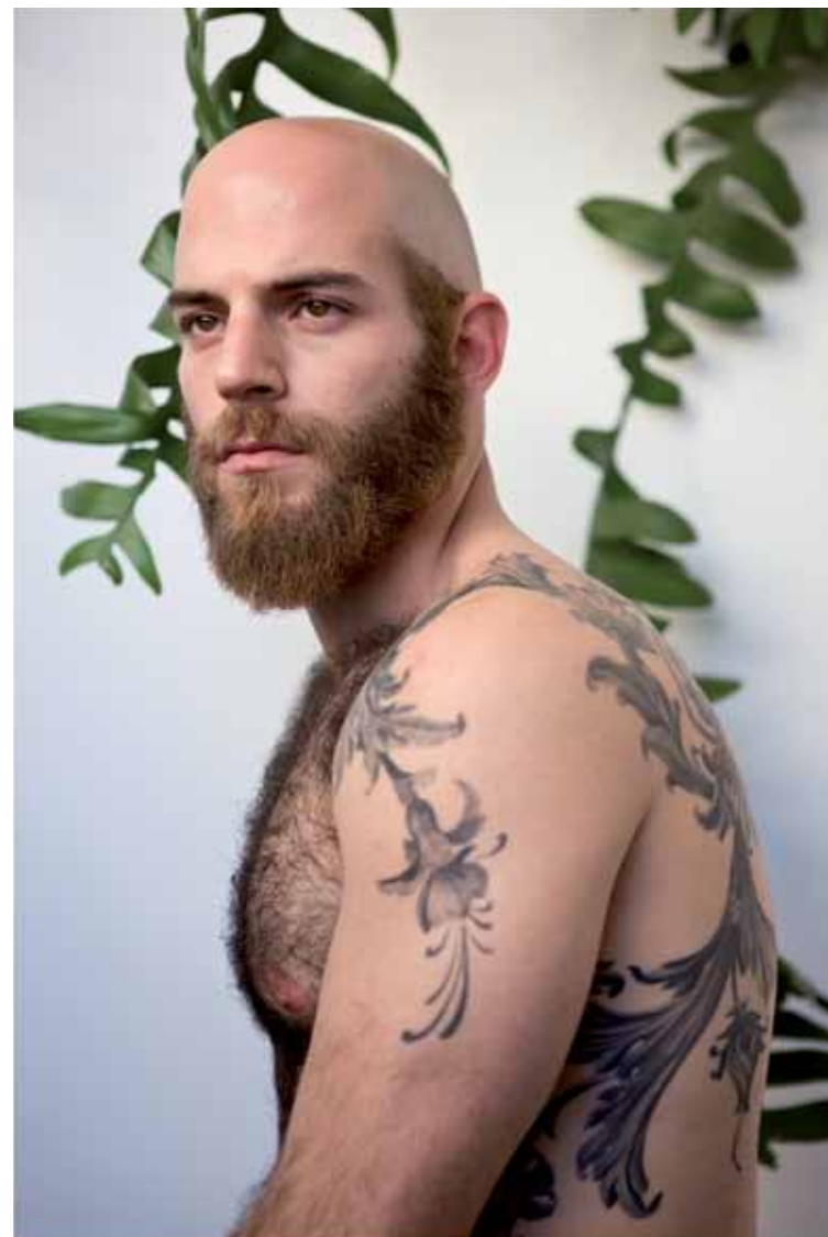
דוד עדיקא, ללא כותרת (עומר), 2010, הדפסת דיו, 86.5x61 David Adika, Untitled (Omer) , 2010, inkjet, 86.5x61