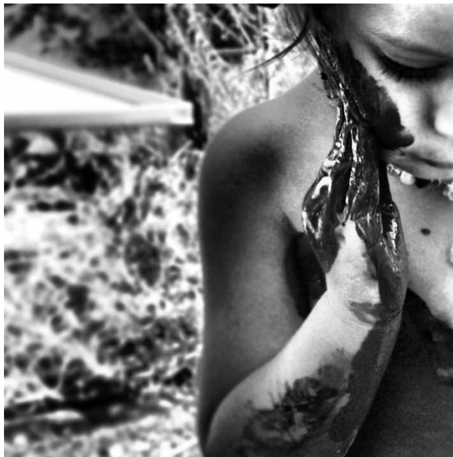
אסתר כהן סקין, ללא כותרת, 2013, עשרה תצלומי שחור-לבן (פרט), אוסף האמנית Ester Cohen Sakin, Untitled , 2013, 10 black & white photographs (detail), artist's collection