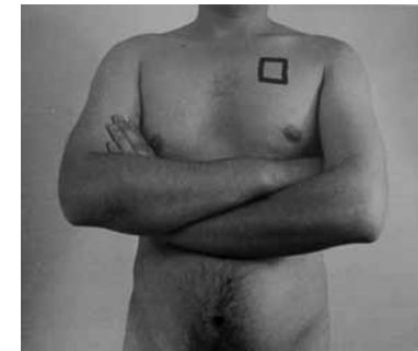
> חיים מאור, ללא כותרת , 1975, תצלום שחור־לבן, 30x40, אוסף האמן Haim Maor, Untitled , 1975, black & white photograph, 30x40, artist's collection