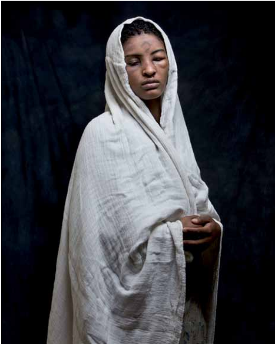
ורדי כהנא, ללא כותרת , (מתוך הסדרה שדות ראייה ), 2009, תצלום צבע 100x80, אוסף האמנית Vardi Kahana, Untitled (from the series Fields of Vision ), 2009, color photograph, 100x80, artist's collection