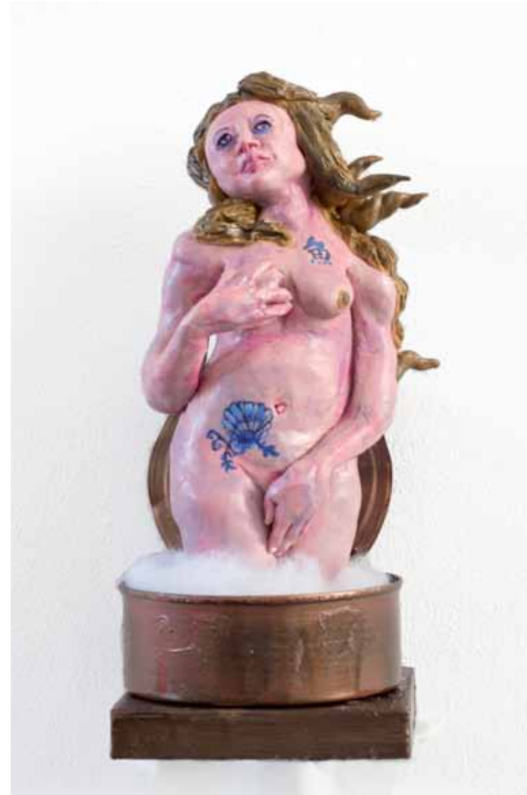
טל פייסיק, ונוס אנדיומנה, 2013, חומר פולימרי וצבעי אקריליק, 21x9x10, אוסף האמן Tal Peisik, Venus Anadyomene , 2013, polymeric clay & acrylic, 21x9x10, artist's collection