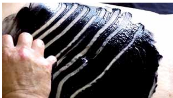
חיים מאור, רישום־מישוש, 1979, 2013, וידאו, 04:11 דק', אוסף האמן Haim Maor, Drawing – Touching , 1979, 2013, video, 04:11 min., artist's collection