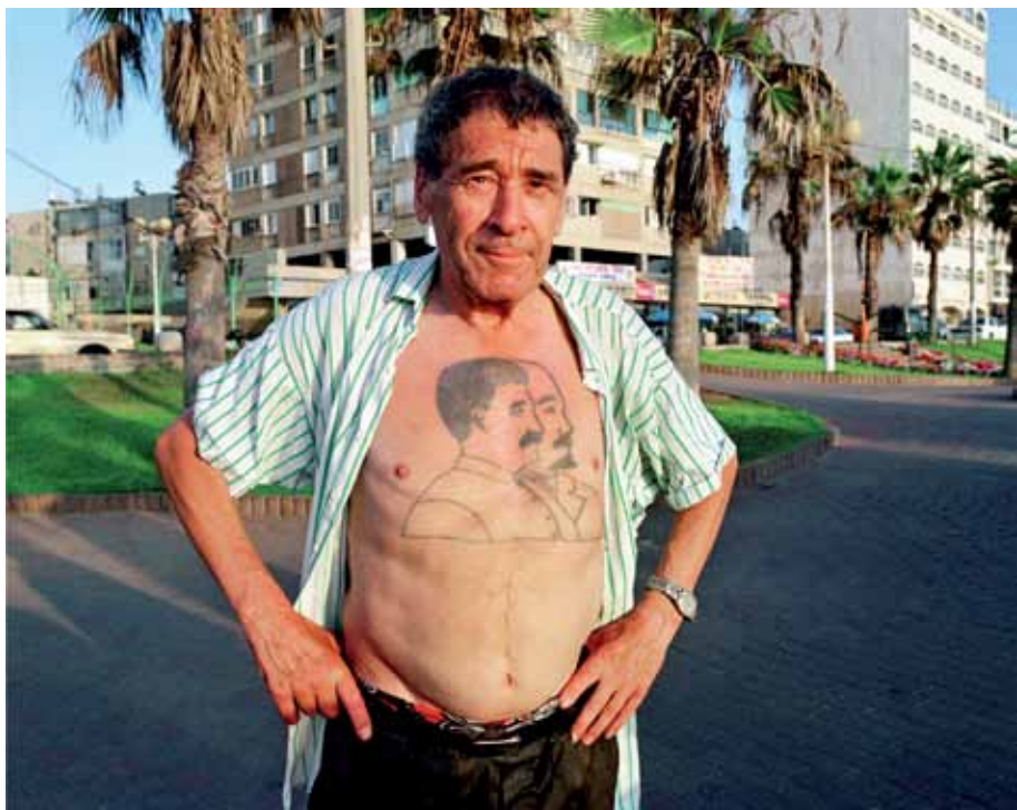
אייל פריד, קעקוע של סטאלין ולנין, 2004, הדפסת דיו, 55x70, אוסף האמן Eyal Fried, Tattoo of Stalin and Lenin , 2004, photographic print, 55x70, artist's collection