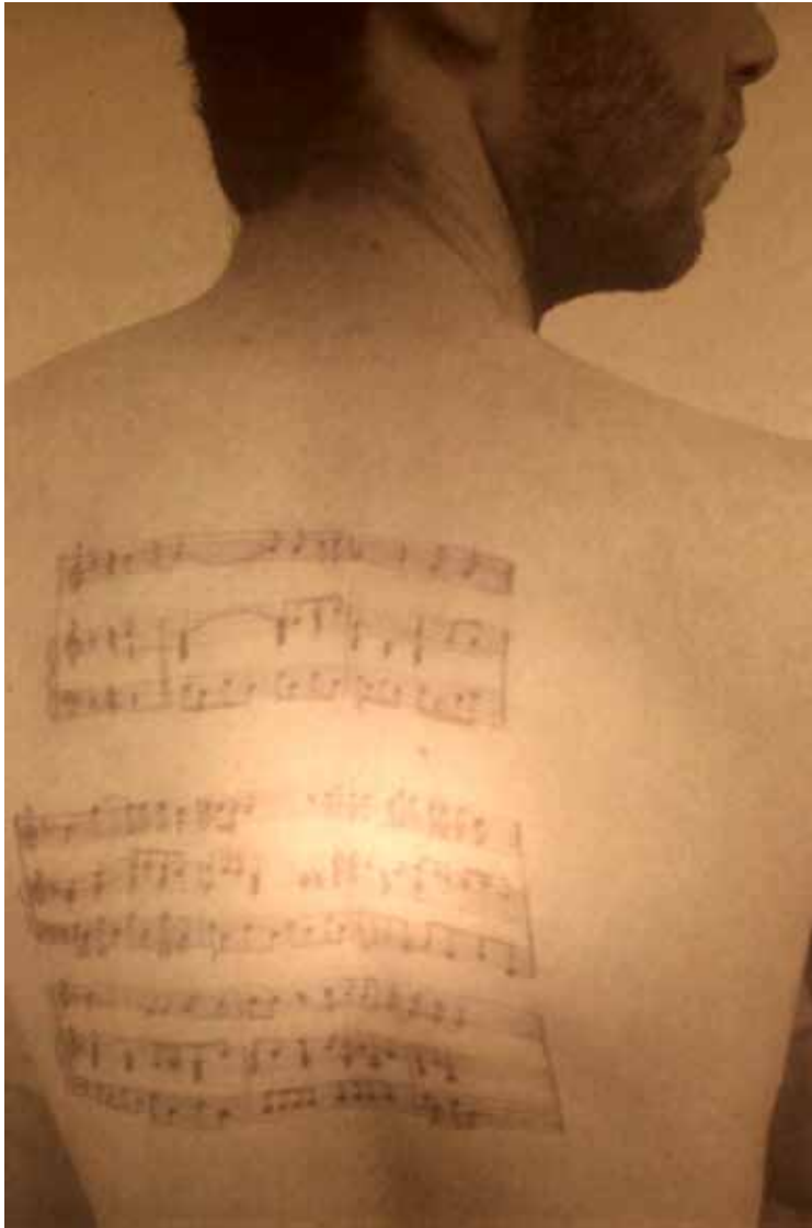
עדן בר, מעבר לעור , שקף צילומי בקופסת אור, 2013, 46x33.6 (פרט), אוסף האמנית Eden Bar, Beyond the skin , 2013, transparent photograph in light box, 46x33.6 (detail), artist's collection