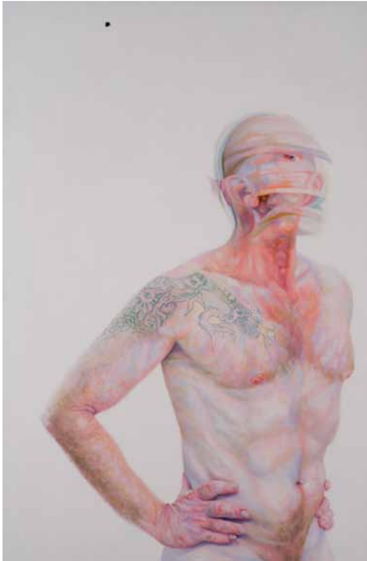
ראובן קופרמן, ראש בתנועה, 2008, שמן על עץ, 120x80, אוסף האמן Ruven Kuperman, Head in Movement , 2008, oil on wood, 80x120, artist's collection