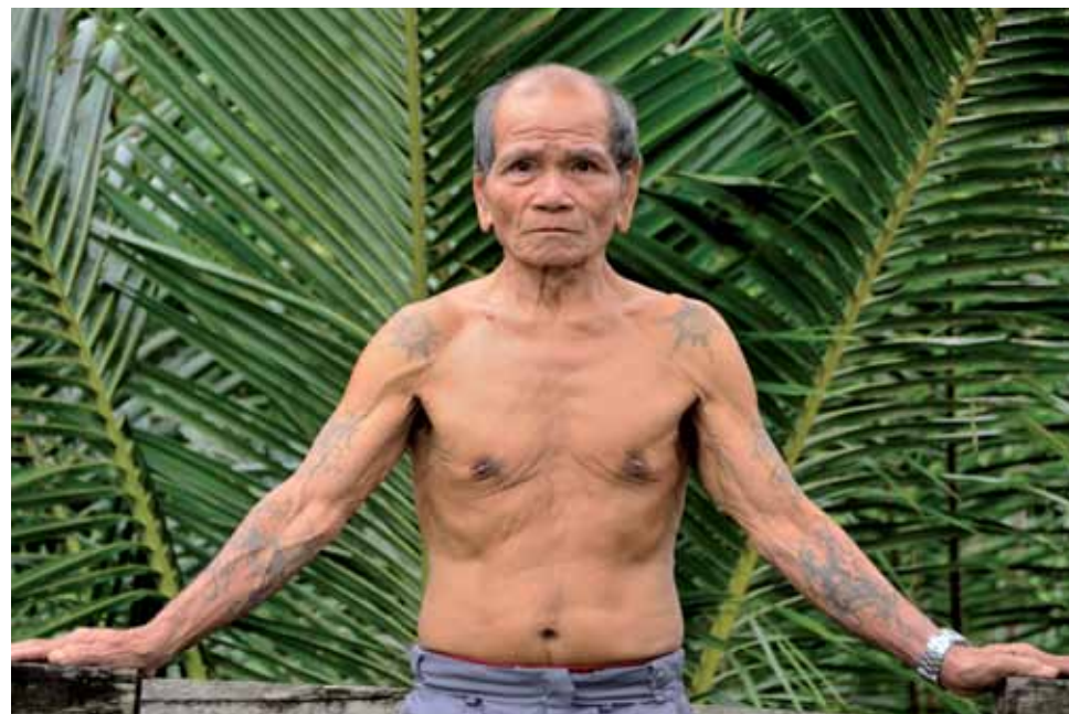
לארס קרוטק, לאהאנאן, נהר ראז'נג, 2009, הזרקת דיו, 40x50, באדיבות האמן Lars Krutak, Lahanan, Rajang river , 2009, inkjet, 40x50, Courtesy of the artist