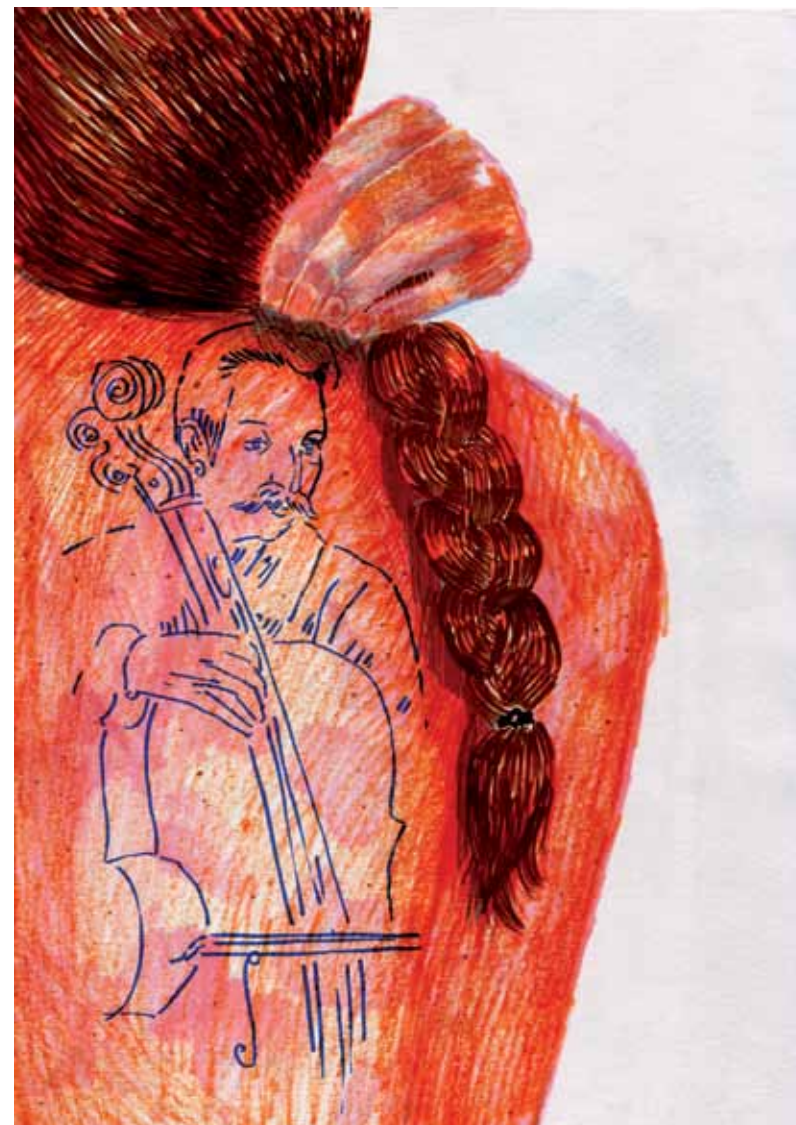
גליה פסטרנק, Gauguin Tattoo , 2013, עפרונות על נייר, 29x21, אוסף האמנות Galia Pasternak, Gauguin Tattoo , 2013, Pencils on Paper, 29x21, artist's collection