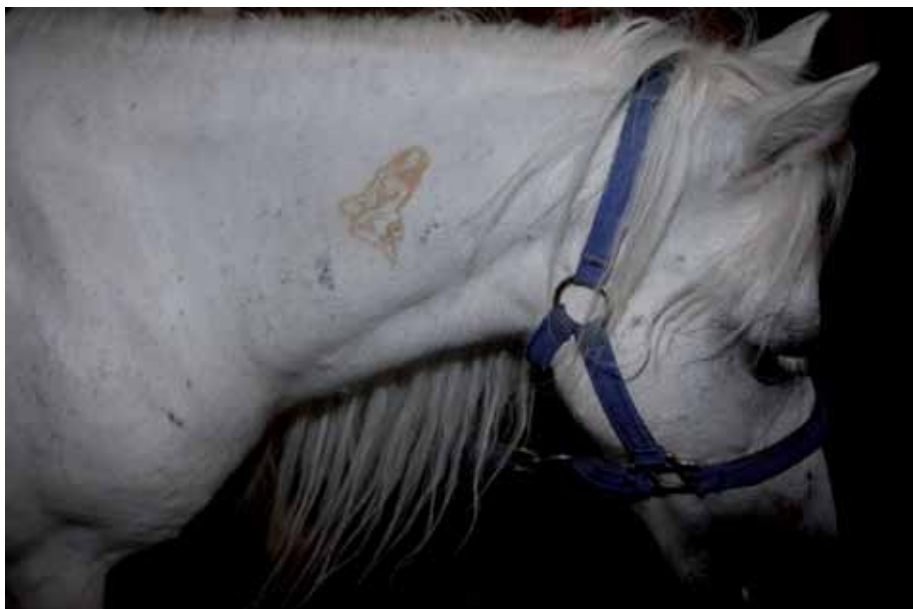
אוהד מטלון, ללא כותרת , 2010, תצלום צבע, 50x75, אוסף האמן Ohad Matalon, Untitled , 2010, c-print, 50x75, artist's collection