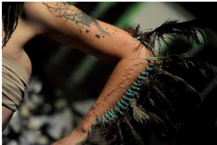
תמי וייט, דניאל נוצות , 2013, תצלום צבע, -----, אוסף האמנית Tami Weiss, Daniel Feathers , 2013, c-print, -----, artist's collection